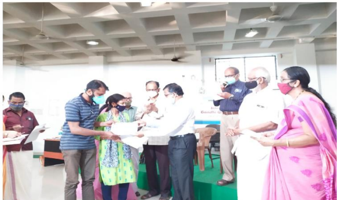
Prepared by Media Cell, FTC