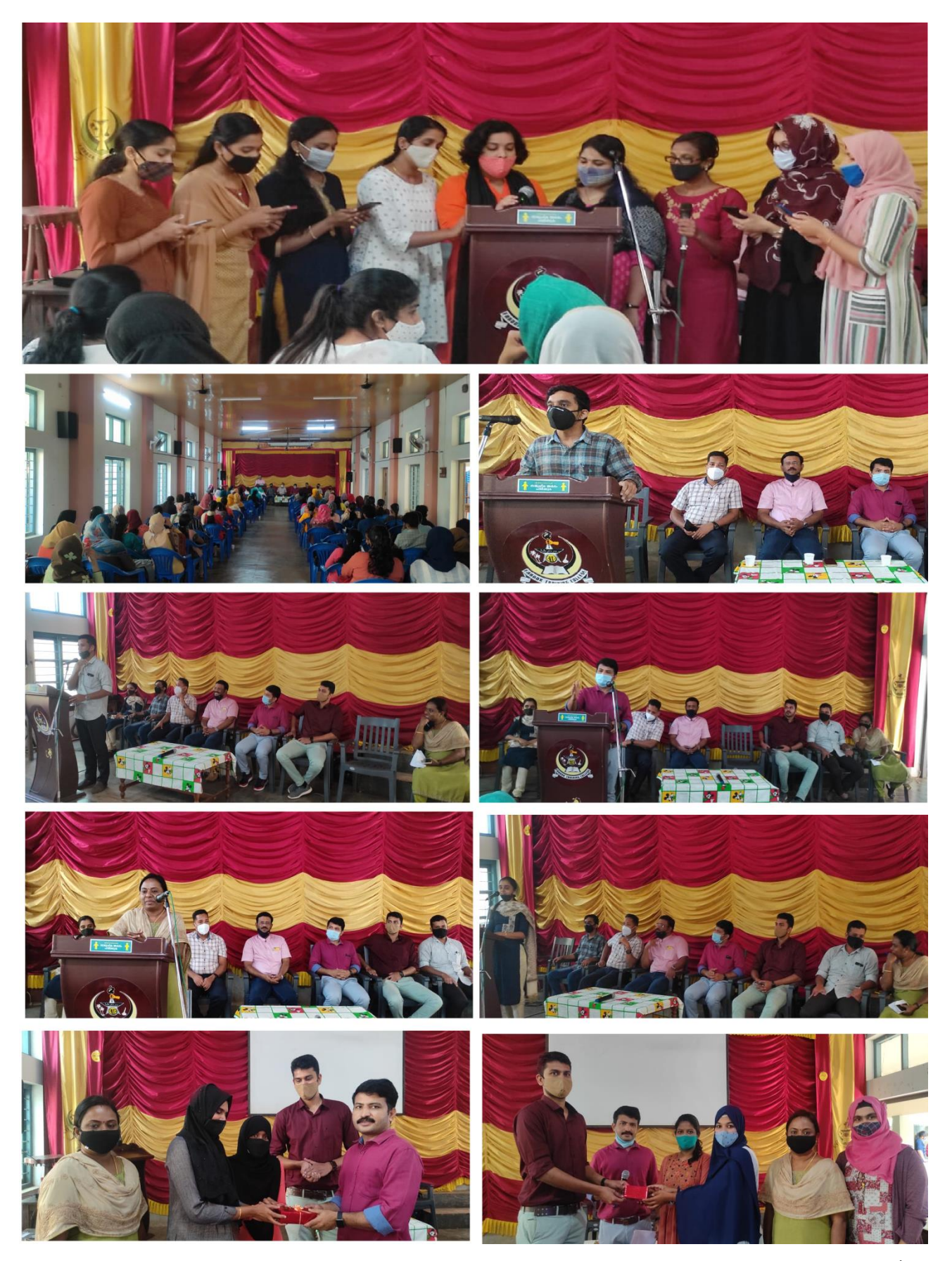
Page | 17