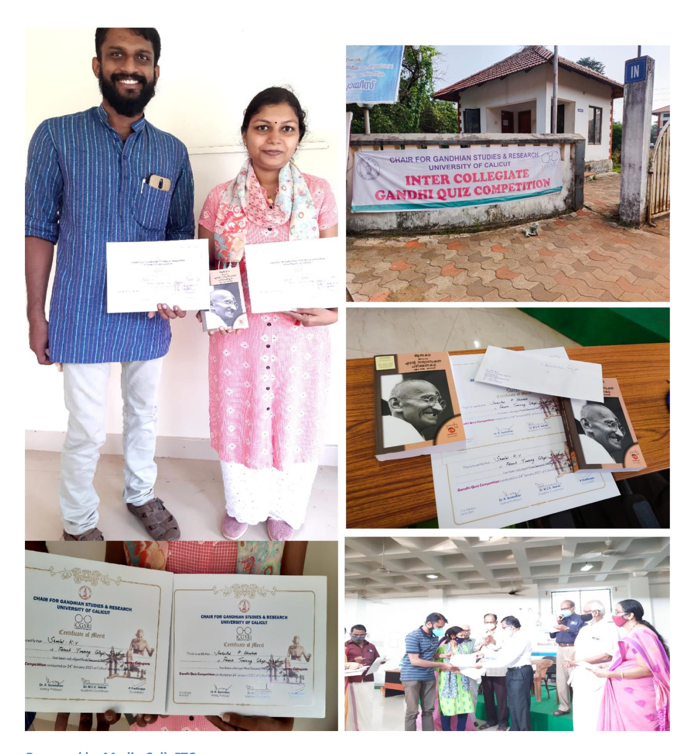
Prepared by Media Cell, FTC