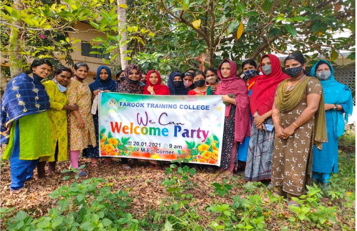
Prepared by Media Cell, FTC