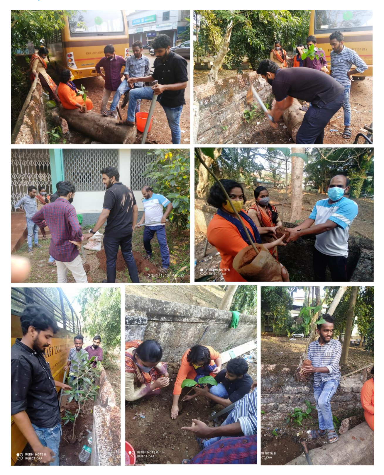
Prepared by Media Cell, FTC